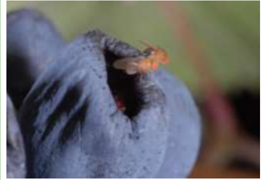
Abb. 1: Vorgeschädigte Beeren werden von Essigfliegen gerne befliegen.