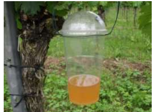
Abb. 4: Standardfalle mit Apfelessig-Wasser-Gemisch für das Fallenmonitoring.

Die Fallen können leicht selbst gebaut werden. Eine Anleitung findet sich auf der Homepage des WBI ( www.wbi-bw.de ). Eine Übersicht über aktuelle Fallenfänge der Rebschutzware, des WBI und der LVWO ist über die Vitimeteo-Homepage abrufbar: www.monitoring.vitimeteo.de