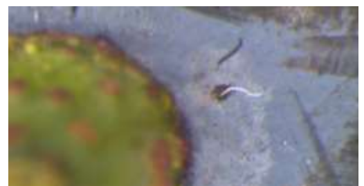
Abb. 5 oben: Probenahme für die Eiablage-Bonitur. Unten: Atemschläuche eines Eies in Stielnähe.