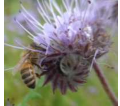
Abb. 6: Bei Bienenflug in der blühenden Begleitvegetation dürfen keine bienengefährlichen Pflanzenschutzmittel eingesetzt werden.

Vorbeugende Behandlungen vor dem Farbumschlag und nach der Ernte sind wirkungslos. Nur zugelassene oder genehmigte Produkte dürfen verwendet werden und die Wartezeit ist einzuhalten. Aufgrund von Resistenzgefährdung sollten die Mittel entsprechend einem von der Beratung empfohlenen Resistenzmanagement (Wechsel der Wirkstoffe) eingesetzt werden. Besonders zu beachten ist die Bienengefährlichkeit einzelner Mittel.