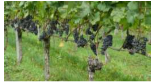
Abb. 3: In einer gut entblättern und damit luftigen Traubenzone sind nachweislich weniger Kirschessigfliegen zu finden.

Feinmaschige Netze um die Traubenzone können ein wirksamer Schutz gegen Befall mit Kirschessigfliege sein.